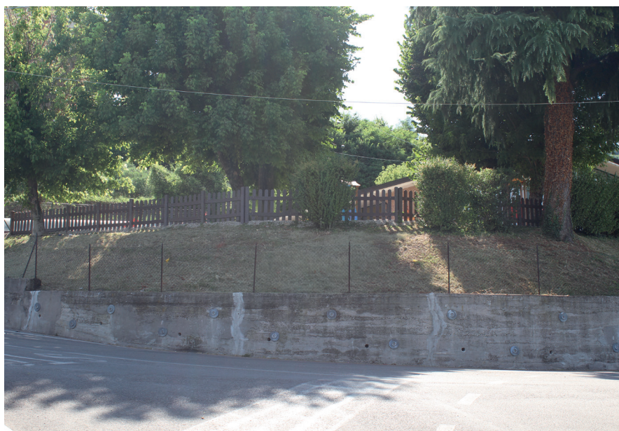
Il consolidamento del muro perimetrale della scuola dell'infanzia.

la navigazione veloce in rete. Un'altra fondamentale iniziativa è stata l'istituzione del Comitato Mensa (con rappresentanti del Comune, dei genitori, dell'Istituto Comprensivo e dell'azienda fornitrice) che coadiuva l'Amministrazione comunale nella periodica valutazione della qualità della mensa scolastica a servizio della scuola dell'infanzia e della scuola primaria.