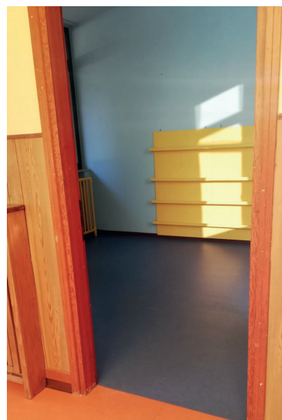
La nuova pavimentazione della scuola dell'infanzia.