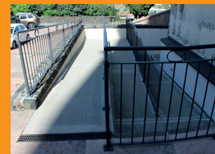
La rampa di accesso alla chiesa