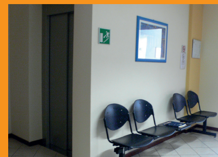
L'ascensore in Municipio

nel nuovo polo culturale e artistico, dove è stata realizzata anche una rampa di accesso per le carrozzine. Una rampa di accesso anche per l'ingresso laterale della chiesa: un intervento della Parrocchia, a cui il Comune ha partecipato con un contributo.