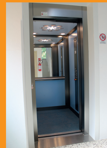
L'ascensore in biblioteca