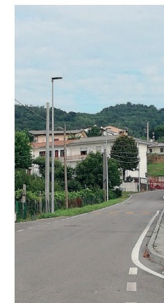
Nuovi lampioni in via Mieli

Raggiunto il 90% dell'illuminazione pubblica con lampade a basso consumo. Un percorso di risparmio energetico reso possibile dall'adesione del Comune all'apposito bando promosso dalla Regione del Veneto. L'attuale Amministrazione ha, infatti, portato a termine un progetto iniziato nel 2014 e che garantisce un notevole risparmio anche in termini economici. È stato inoltre aumentato, per una maggiore sicurezza, il numero di lampioni nelle vie Mieli, Marangoni e Oltre Chiampo.