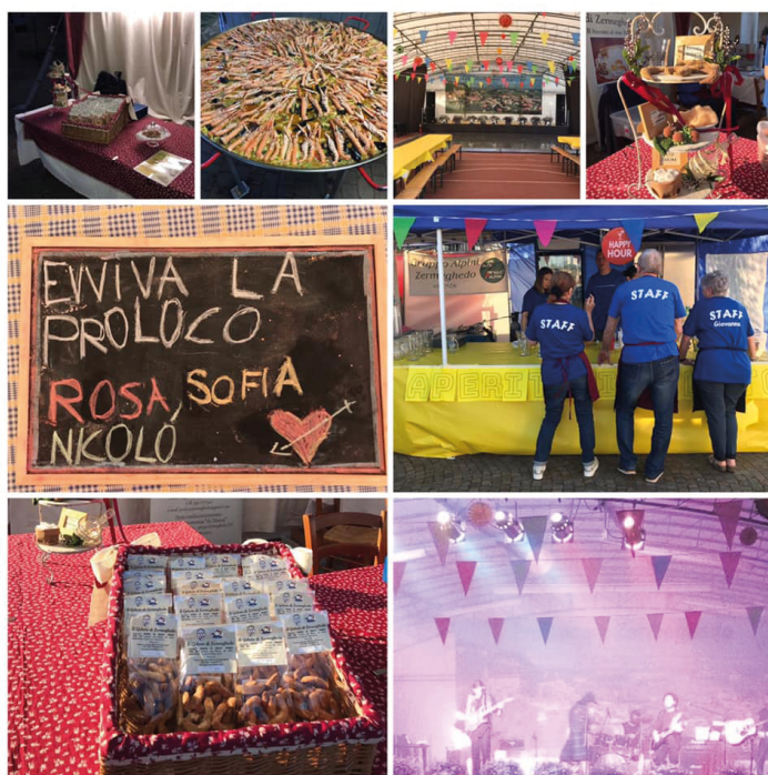
FESTA DEL GOBETO

Un 2019 di grandi successi anche per il Gruppo Podistico Zermeghedo , che in collaborazione con la stessa Pro Loco ha organizzato la Marcia dei 5 Campanili , capace di attirare 1170 persone. E già si pensa al 2020!