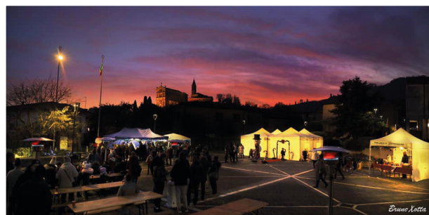
LA MAGIA DEL NATALE IN PIAZZA